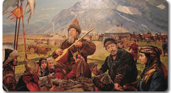
Dede Korkut Hikâyeleri